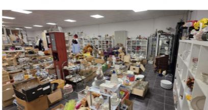
Im Sozialkaufhaus in Stolberg gibt es nicht nur Haushaltswaren, Kleidung und Spielzeug für Bedürftige, auch sozial benachteiligte Menschen bekommen eine Perspektive geboten.

Frings weiß, wie wichtig solche Strukturen für die Betroffenen sind. „Es sind ein paar Stunden in der Woche oder am Tag, in denen es nicht um das Gedankenchaos geht, um Geldsorgen und andere Probleme“, sagt sie. Dieses Stück Normalität verleihe den Menschen auch ein Gefühl von Identität. Langfristiges Ziel ist stets die Wiedereingliederung in den ersten Arbeitsmarkt – die Wabe fungiert an dieser Stelle auch als Brücke.