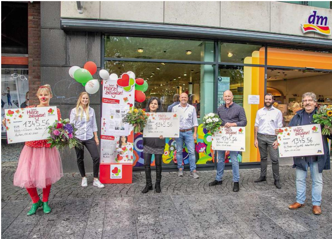
Am 28.09. war großer dm-Spendentag: Viele Menschen nutzten die Gelegenheit und kauften bei dm ein.